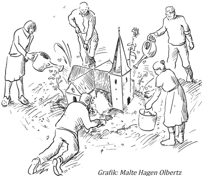
Grafik: Malte Hagen Olbertz

Wir alle haben Phasen, in denen wir nicht so leistungsfähig sind wie andere es von uns vielleicht gewohnt sind.