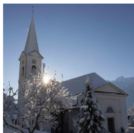
St. Viktor u. Markus