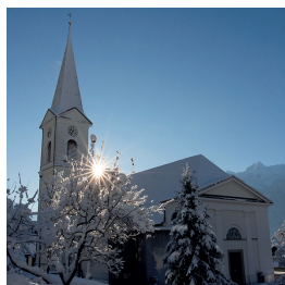
St. Viktor u. Markus