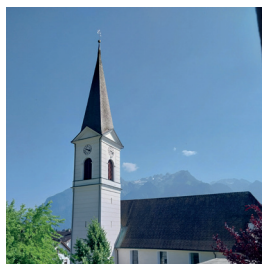
St. Viktor u. Markus