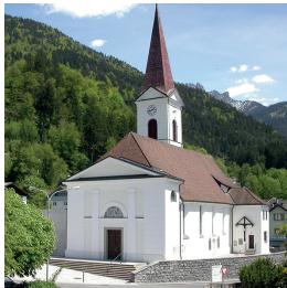
St. Viktor u. Markus