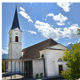
St. Viktor u. Markus