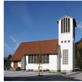
Hl. Joh. Nepomuk