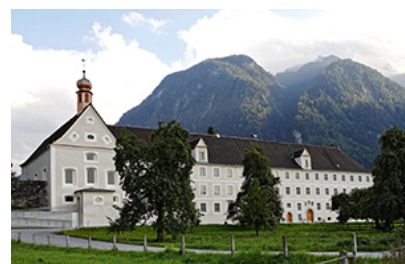
Kloster St. Peter

Die Kirchen weisen immer auf den Höheren hin.